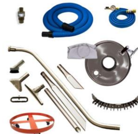
Esempio di aspiratore Deluxe Heavy Duty Dry Vac per fusti da 100 e 200 litri