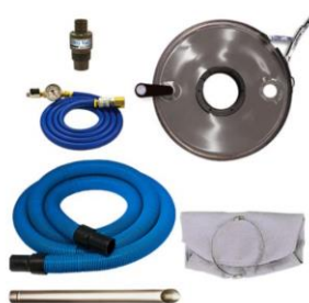
Esempio di aspiratore Heavy Duty Dry Vac per fusti da 100 e 200 litri