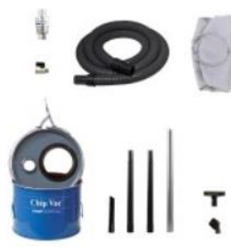
Esempio di aspiratore Mini Chip Vac con fusto da 20 litri in dotazione