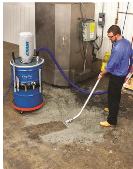
Deluxe Heavy Duty Chip Vac da 100 litri aspira granuli per sabbatura

Guarda i prodotti in funzione su youtube, cerca: maguglianisrl