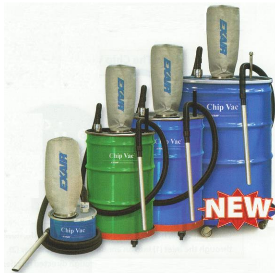
Aspiratori Chip Vac Exair disponibili per fusti da 20 100 200 400 litri