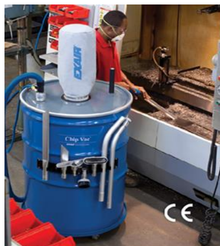
Premium Chip Vac da 400 litri aspira residui di lavorazione