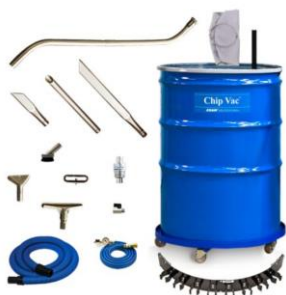
Esempio di aspiratore Premium Chip Vac con fusto da 100 litri e carrello in dotazione