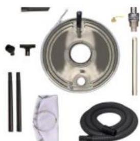
Esempio di aspiratore Chip Vac per fusti da 100 e 200 litri