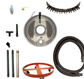
Esempio di aspiratore Deluxe Chip Vac per fusti da 100 e 200 litri