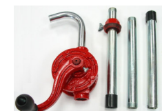
Pompa rotativa MIXI 2169