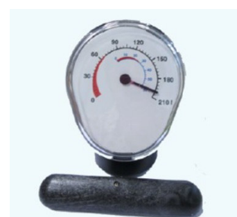
Indicatore di livello