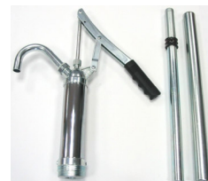
Pompa a pistone MIXI MA3