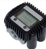
Contaltri MIXI PUROIL