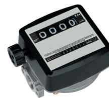
Contaltri MIXI K44 OIL