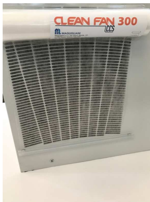
CLEAN FAN CCS sistema di filtrazione aria installato su un condizionatore