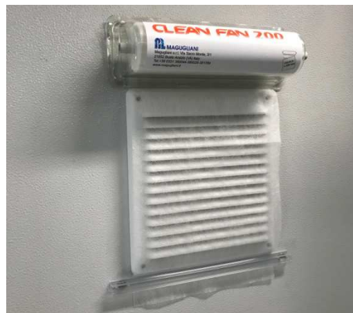
CLEAN FAN installato su ventola di un armadio elettrico