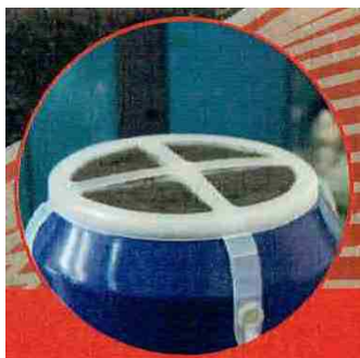
CLEAN FAN MOTOR sistema di filtrazione di ventole di motori