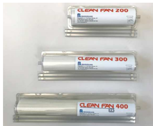
CLEAN FAN e CLEAN FAN CCS sistema di filtrazione aria per ventole di armadi elettrici, condizionatori, compressori, scambiatori