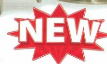
Sanitary Flanged Line Vac